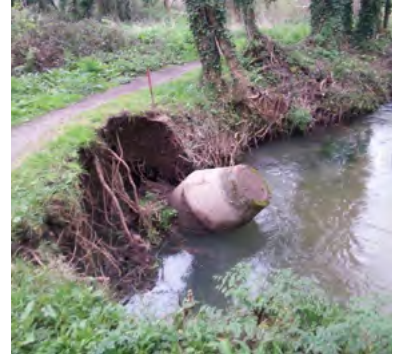
ESTRAGOS DO INVERNO NO SANEAMENTO

O compromiso co medio ambiente e coa calidade de vida da veciñanza leva ao Concello a procurar novos aliados (neste caso a Deputación) e a seguir adiante co proxecto de saneamento do Gafos, que terá un custe aproximado de 1,1 millóns de euros.